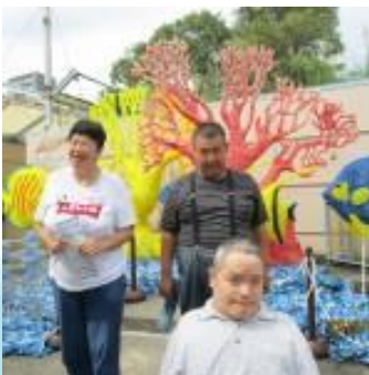
秋の遠足 (須磨水族館)