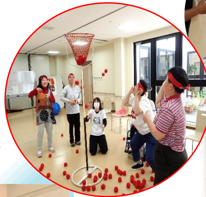
令和最初のスポーツ大会