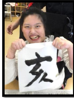
平成最後の書初め