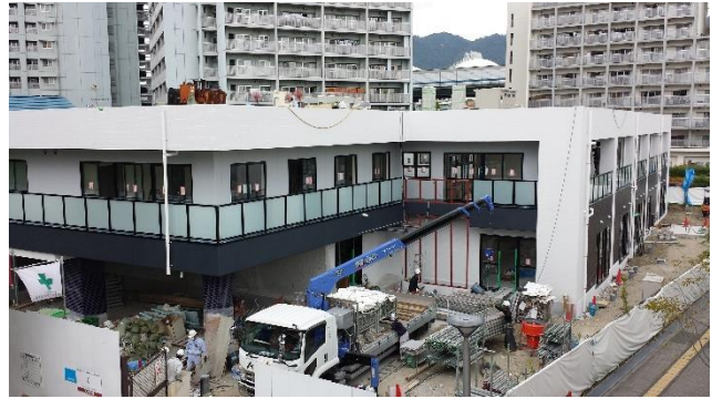
開所1ヵ月前工事風景