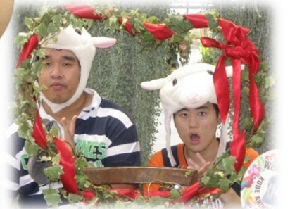
秋の遠足(神戸どうぶつ王国)