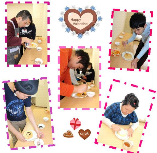
バレンタイン企画(パンケーキ作り)