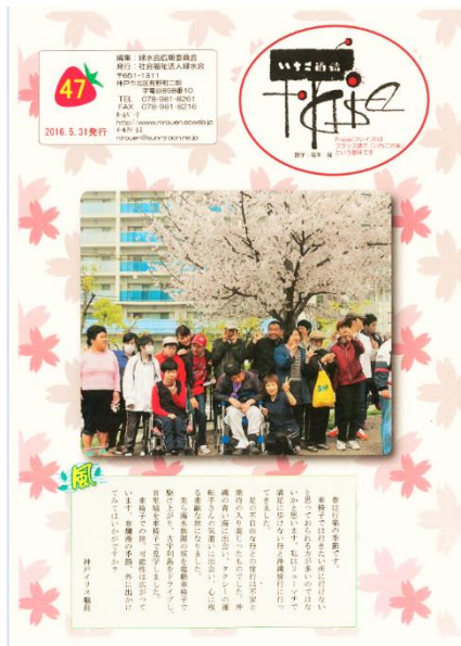
初の3施設合同広報誌“フレイズ 47号”