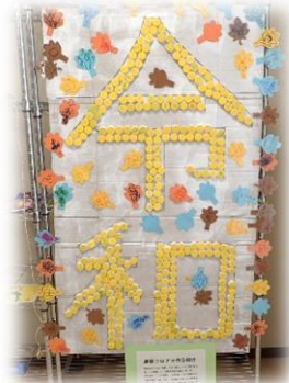
ご利用者様と職員共同制作 ペットボトルキャップ 元号

設立5周年、令和になって初めてのフェスティバル。開所当初からのご利用者様や新しいご利用者様とご家族様に支えられ5周年を迎えられることは非常に光栄なことです。職員一同これからもより良い施設を目指し、がんばっていききたいと思います。