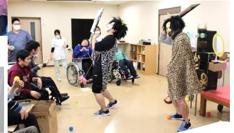
豆まき(みんなで鬼退治!)