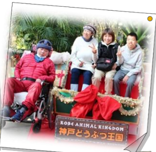
(神戸どうぶつ王国) 秋の遠足