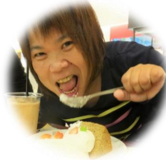
満面の笑みの春のお食事外出(HAT 神戸ブルメール)