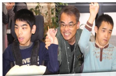
1周年記念フェスティバル ご利用者様、 ご家族様の素敵な笑顔