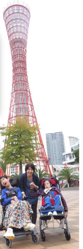
ポートタワーにて