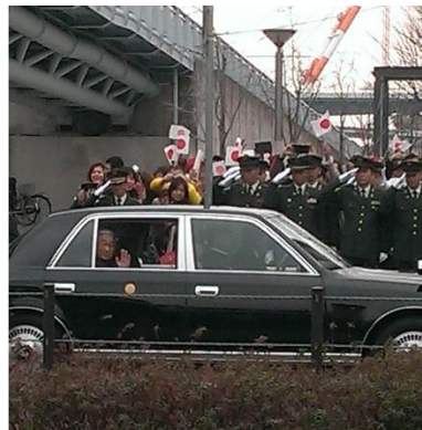
現・上皇陛下 HAT 神戸来訪